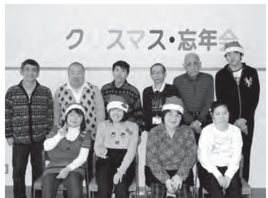
写真は平成26年12月19日に開催されたあざれあ工房の「クリスマス・忘年会」の様