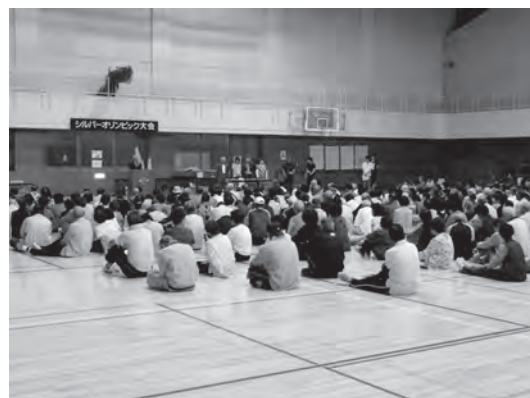
写真は平成26年6月12日に開催されたシルバーオリンピック