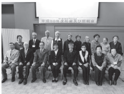
懇親会後の集合写真