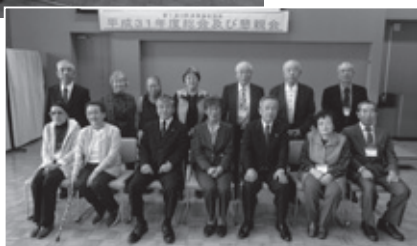
懇親会後の集合写真