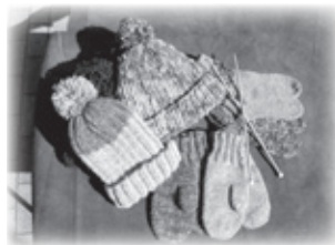
くつ下・ほうし・手袋