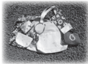
バッグ・ポーチ・巾着