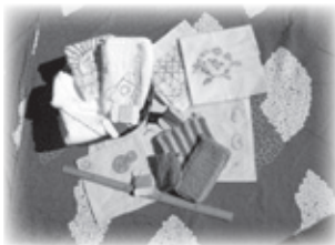
ししゅうタオル ふきん・雑巾 ナイロンタワシ ランチョンマット