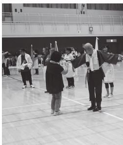
種目「かかしリレー」むぎわら帽子、半纏などを着つけ、「かかし」をいち早く完成させます。かかしの出来栄は如何に？

また、知識と経験を生かして、地域の諸団体と共同活動しながら、地域を豊かにする社会活動にも取り組んでいます。今年度実施した活動の一部を紹介します。