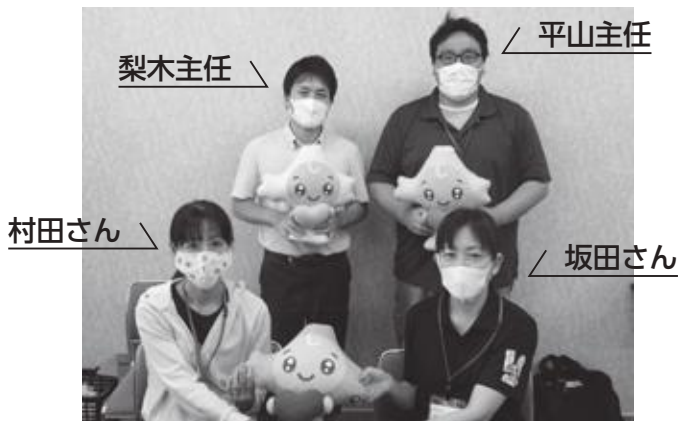
梨木主任 \ 平山主任