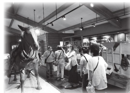
あざれあ工房社会見学