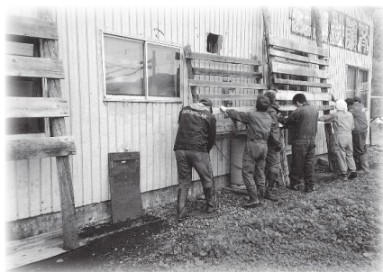
地域福祉実践活動推進事業