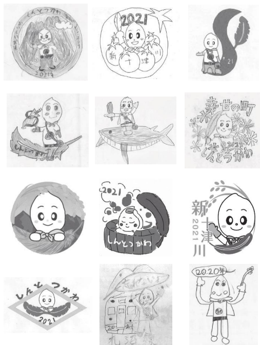
応募された作品の一部です。

新十津川町共同募金委員会では、広く赤い羽根共同募金をPRすることや募金増強を目的に2016年から赤い羽根と新十津川町観光PRキャラクター「とつかわ こめぞー」がコラボしたご当地ピンバッジを作成しています。 町民のみなさんに赤い羽根共同募金を身近に感じてもらうことを目的に、10月1日から始まる赤い羽根共同募金運動の実施期間に合わせて、「ご当地ピンバッジデザインコンクール」を行いました。募集期間中、小学生から70代の方までの幅広い世代から合計28作品の応募がありました。ありがとうございました。 応募いただいた作品は、このあと共同募金委員会の役員による審査を行い、最優秀作品に選ばれた作品のデザインをもとに、令和3年度のご当地ピンバッジを作成します。