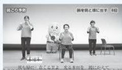
しんとつかわ音頭