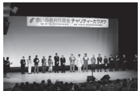
大盛況に終わったチャリティーカラオケ