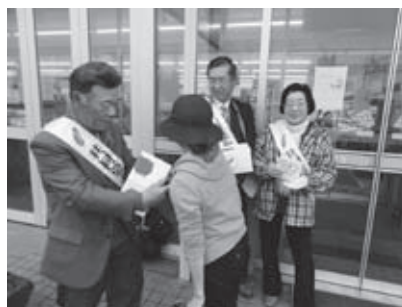
町内で協力を呼びかけた街頭募金