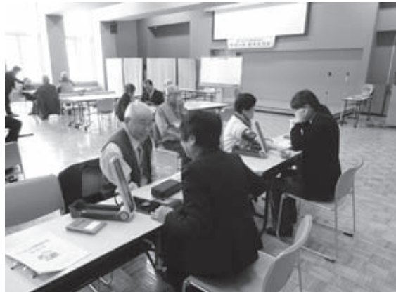
会員の健康相談と血圧測定の様子

樹町議会議長より祝辞が述べられた後、参加者全員で祝賀会食やビンゴゲームなどで楽しみ、会員相互の連携を深めました