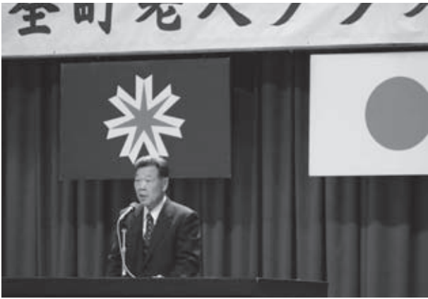
新年の挨拶を述べる仲西会長

懇親会では、新年の挨拶を交わしたり、演芸発表を見るなどして笑顔あふれる新年交礼会となりました。